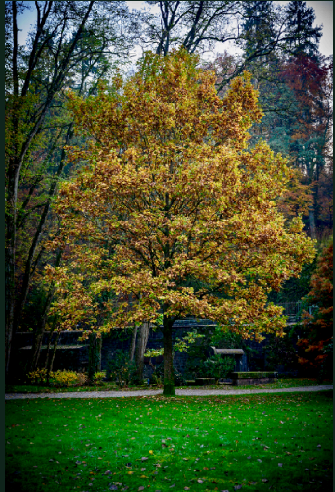
Foto: Quercus palustris - Sumpfeiche - gepflanzt 2013 | ca. 40 Jahre | 11 Meter

Durch meine enge Zusammenarbeit mit der Baumschule LvE kann ich Ihnen zu derartigen Exemplaren zu deutlich günstigeren Konditionen verhelfen.